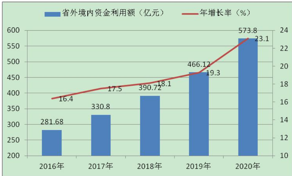
图 1-2 “十三五”期间省外境内资金利用情况

二、对外贸易实现快速增长。 全市有进出口实绩的企业达 903 家，比 2015 年底新增 728 家，其中年进出口额超 1 亿美元企业 2 家，培育了工程机械、电子信息、生物中医药、小五金、发制品、打火机、服饰箱包鞋帽、体育用品、竹木、果蔬等新十大出口基地；2020 年货物贸易进出口总额、出口额分别达 38.01 亿美元、37.27 亿美元，比 2015 年分别增长 232%、258.4%，外贸依存度从 2015 年的 5.12% 上升到 11.65%。出口总量、有进出口实绩的企业数量和出口退税额居全省第 2 位，2018 年发制品、打火机、箱包三个基地获批国家外贸转型升级基地，连续四年获评全省外贸先进市州。