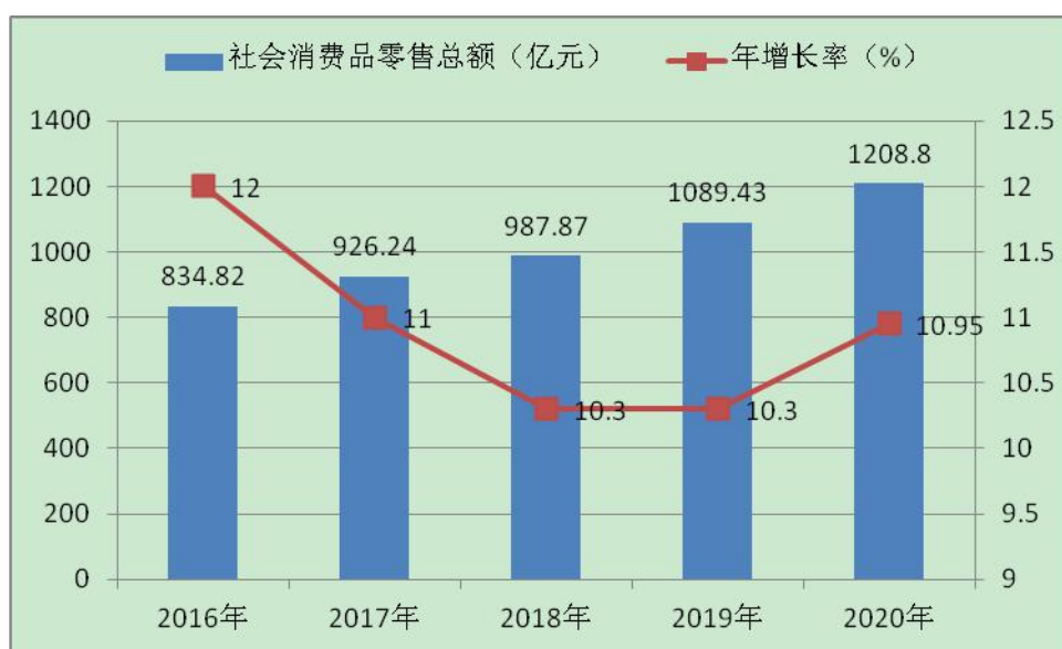
图 1-4 “十三五”期间社会消费品零售总额情况

商务进农村综合示范县，2019年、2020年连续两年获评全省电商扶贫工作优秀市州。全市通过邮政、供销、农村淘宝等电商平台建成县级电商公共服务中心9个、发展村级电子商务网点1831个，其中贫困村电商服务站970个，覆盖率达90%。