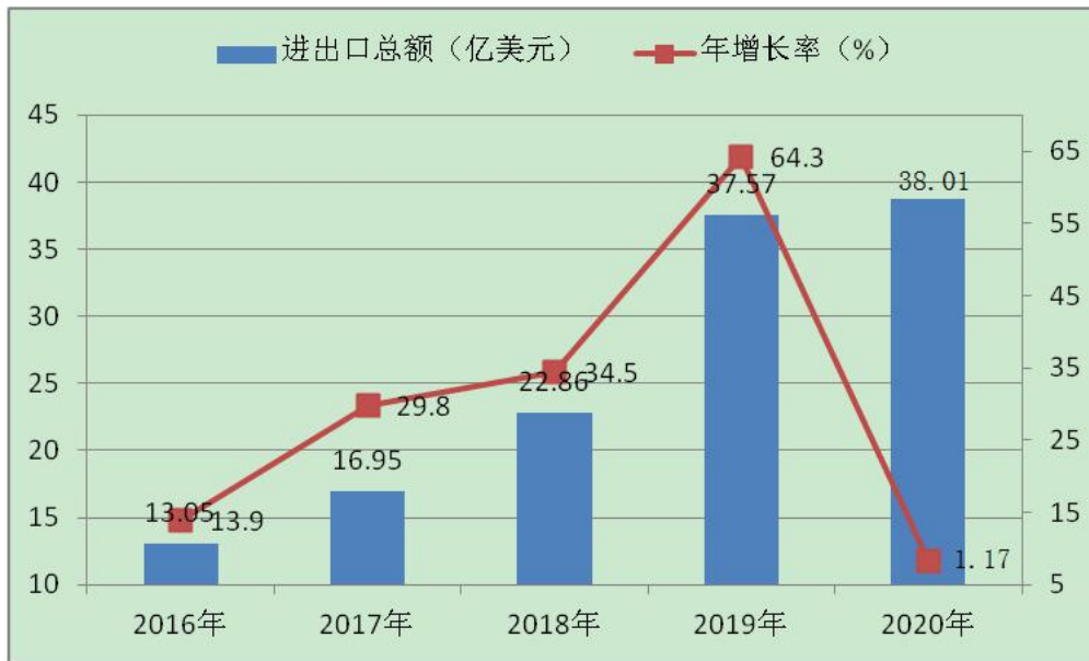
图 1-3 “十三五” 期间进出口额情况

三、商贸流通取得良好进展。 消费总量较快增长，全市实现社会消费品零售总额从 2015 年的 747.3 亿元增长到 2020 年的 1208.8 亿元，年均增长 10.1%，增速高于全省平均水平，“吃”、“住”、“购”等商贸供给不断丰富优化。商贸服务业发展迅速，编制完成《邵阳市城区商业网点规划》，餐饮、家政、特许经营等行业新型业态不断出现。全市现有成品油加油站点 483 个、拍卖企业 16 家、特许经营备案企业 4 家、报废机动车回收拆解企业 5 家、二手车交易市场 14 家、再生资源回收企业 800 余家、全国绿色示范商场 1 个、“湖南老字号”品牌 8 个。“十三五”期末限额以上贸易企业达到 1953 家，比“十二五”末新增 947 家。电子商务发展迅速，电子商务交易额从 2015 年的 80 亿元增长到 400 亿元，年均增长 50%。全市 9 个县市全部列入全国电子