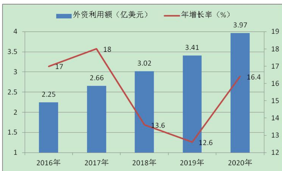
图 1-1 “十三五”期间利用外资情况

一、招商引资取得较好成绩。全市实际利用外资从 2015 年的 1.98 亿美元增长到 2020 年的 3.97 亿美元，年均增长 15%，利用省外境内资金从 2015 年的 242 亿元增长到 2020 年的 573.8 亿元，年均增长 18.6%。围绕建链强链，坚持招大引强，先后引进了中电彩虹、九兴控股、慕容集团、拓浦精工、亚洲富士电梯、桑德集团、帝立德等一批行业龙头企业，其中“三类 500 强”企业 26 家，为我市产业发展注入了强劲动力。